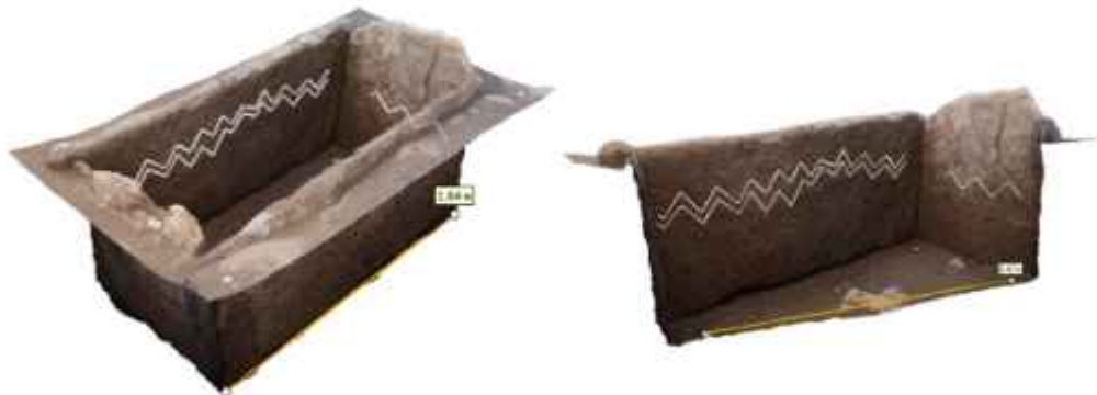
Görsel 1. Şöje Bronz Çağı Çevrelemesi, Nesne No. 5. Mezar Odası Duvarlarındaki Zikzak Semboller.

Farklı dönemlere ait anıtları kapsayan Şöje Bronz Çağına ayıt olan bir Çevreleme – Sakların yerleşimleri ve kurgan sistemlerini, ayrıca çeşitli çağların anıtlarını barındıran Akbaur arkeolojik kompleksinin 2,5 km güneyinde, Şöje ve Uranhay nehirlerinin birleştiği, doğası görkemli bir bölgede yer almaktadır. 2024 yılında, iri taneli granit levhalardan yapılmış iki mezar odası bulunan, paleometal dönemine ait bir çevreleme tespit edilerek incelenmiştir göstermektedir. Odalardan birinin duvarlarında, inşa veya gömme-anımsatma törenleri sırasında kazınmış, “su/dalga” ya da “kıvrımlı” damgaları andıran yatay zikzak çizgilerden oluşan geometrik semboller belirlenmiştir. (görsel 1) [Samashev, Samashev, Zhuniskhanov, Sirazheva, 2024: 861-888].