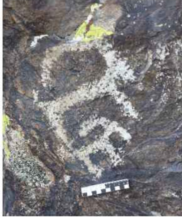
Görsel 5. Mañırak Petroglifleri

Şilikti ovasına giden yolun sol tarafındaki bir tepede, kaya resimleri ve eski Türk işaretleri bulunmuştur. Erken demir çağına ait motifler, hayvan üslubunda yapılmış hayvan tasvirleriyle (görsel 5), ayrıca antropomorfik figürler ve atlı savaşçı sahneleriyle temsil edilmiştir. Bu tasvirler, dönemin sanat kültürünün kendine özgü özelliklerini yansıtır. Arkeolojik anıt, tarihlendirme açısından çok katmanlıdır. Taşlarda erozyon ve aşınmanın belirgin izleri vardır: yüzeylerinde çatlaklar ve liken birikimleri gözlemlenmiştir. Bu doğal koşulların uzun vadeli etkisi, petrogliflerin doğru şekilde yorumlanmasını önemli ölçüde zorlaştırmaktadır.