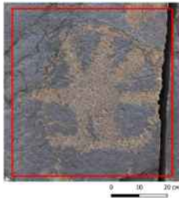
Görsel 10. Moynak Petroglifleri, Yüzey 2