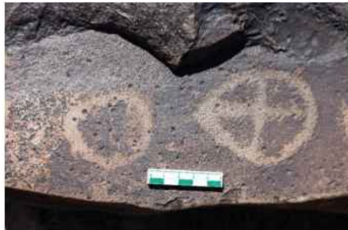
Görsel 6. Şıymaylı Petroglifleri

Şıymaylı Petroglifleri , dokuzdan fazla petroglif grubu ve Moldajar vadisindeki tunç çağı nekropolünden oluşan bir kaya sanatı kompleksidir. Yerleşim alanı içinde, yüksek patinasyonlu ana kayaların çıkıntı yaptığı birkaç küçük tepe vardır. Bu tepelerden dokuzdan fazlası bilinir ve bazılarının kendi yerel isimleri vardır. Bunlardan biri, yerel halk arasında Sardongal olarak bilinen en yüksek tepedir. En fazla petroglif bu noktada toplanmış olup, bu kompleks Şıymaylı-I olarak adlandırılmıştır (görsel 6).