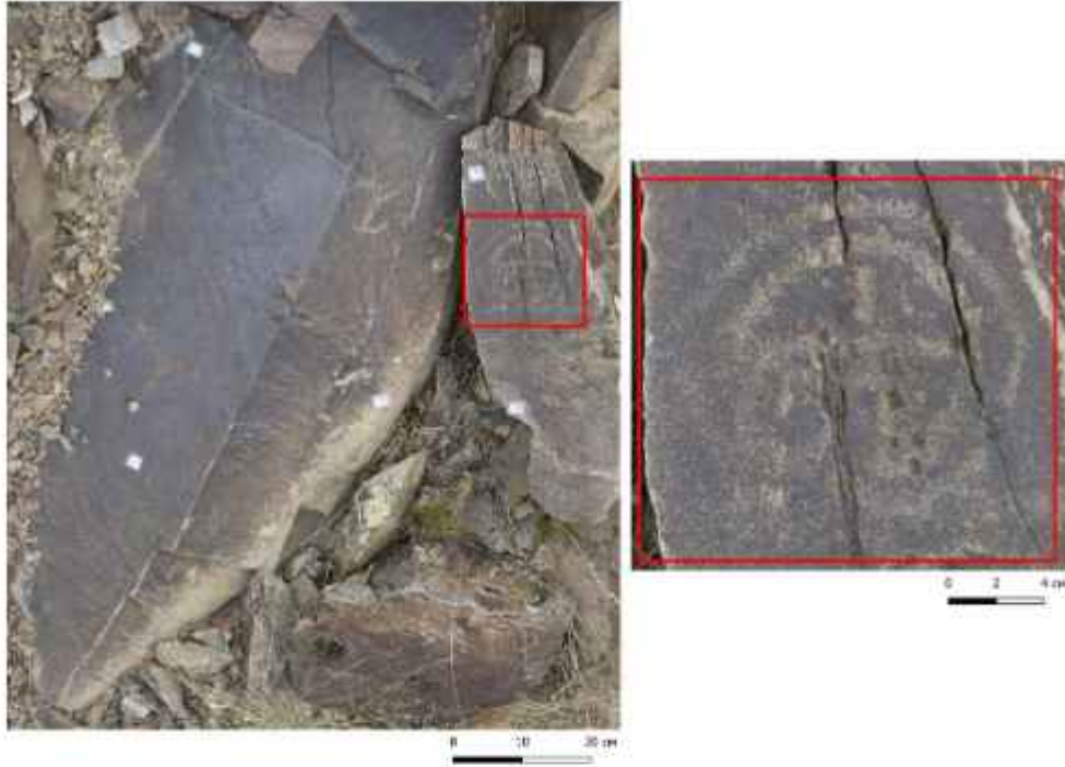
Görsel 9. Moynak Petroglifleri, Yüzey 1