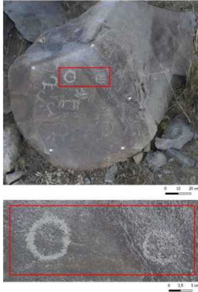
Görsel 7. Dolanalı Petroglifleri, Yüzey 3

bir işaret mevcuttur; Yüzey 3: Yatay konuma sahiptir. Üzerinde iki adet işaret bulunmaktadır. (Görsel 7).